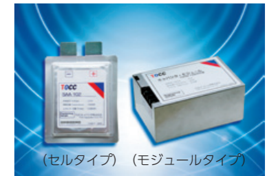
【電気二重層キャパシタの製品】

用途としては、建設機械分野、非常誘導灯などのLED照明の電源、無停電電源装置や瞬停装置のバックアップ、EVの蓄電、バッテリーアシストなどです。既にサンプル品の出荷を進めており、それらで得た情報をもとに本格的な販売を開始いたします。