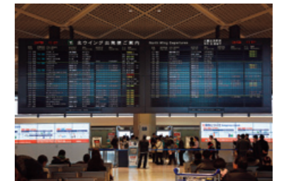
【成田国際空港の出発便ご案内ディスプレイ】

成田国際空港第一ターミナル北ウィング出発ロビーの出発便ご案内ディスプレイに当社の「FS-LCD（フィールドシーケンシャル方式カラーLCDモジュール）」が採用され、2013年12月に供用開始されました。「FS-LCD」はフルカラーLED表示器に比べて消費電力が低い、視野角が広い、発熱が低い、引き締まった黒色表現ができるなどの特色があります。「FS-LCD」が成田国際空港で採用されるのは今回が2箇所目であり、他に中国の上海虹橋空港の出発・到着ターミナルや韓国の鉄道の駅ホーム、国内の消防局の緊急車両統括管理システムボードなどに採用されています。今後も、当製品の特長を活かした拡販をすすめて参ります。