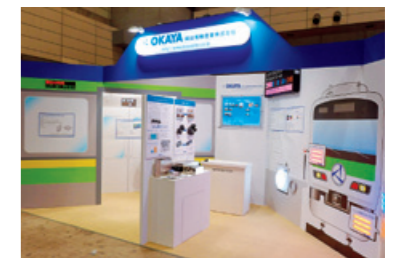
【鉄道技術展の当社ブース】

2013年11月6日から8日にかけて幕張メッセで開催された「第3回 鉄道技術展」に、当社も各種製品を持って出展しました。当技術展は車両技術のみならず、鉄道分野の技術が一堂に会する総合見本市であり、多くの出展企業・関連団体が参加しました。駅の照明、各種表示装置、信号保安装置などは当社製品が使用される頻度も高く、会場ではご来場のお客様と当社担当者による熱心な商談や、情報交換が行われました。当社製品の仕様書・サンプル品の要求やカスタム品の試作依頼などに繋がり、今後も更なる新規市場の拡大が期待されます。